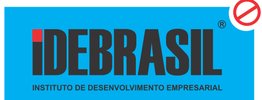
Sobre fundos azuis