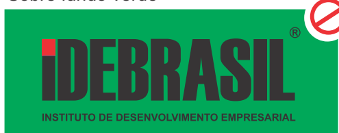
Sobre fundo verde