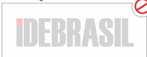
Marca D'água da versão colorida