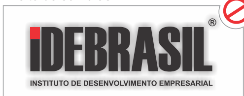
Efeito de sombras